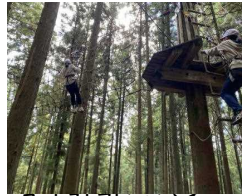
フォレストハンサー