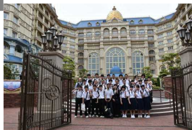
ディズニーランド前