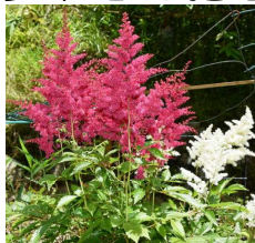
体育館横アスファルト