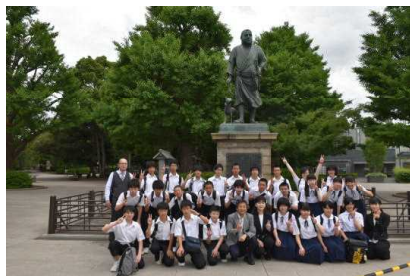
上野公園 西郷隆盛銅像前